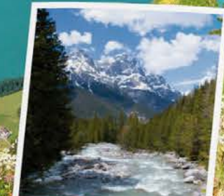
LANDSCHAFTEN Schweizerischer Nationalpark Leist auf eine Begegnung mit Bären und Wölfen! Dann nichts wie hin zum Nationalpark. Mit seiner Gründung im Jahr 1914 wollte man der fortschreitenden Industrialisierung und Zerstörung der Natur Einhalt gebieten. Mit Erfolg! Bis heute wird der Park stetig erweitert und gehört seit 1979 zum UNESCO-Biosphärenreservat.