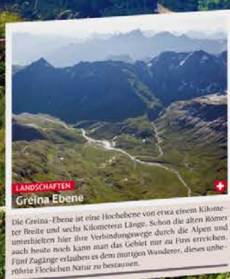
LANDSCHAFTEN Gröna Ebene Die Gröna-Ebene ist eine Hochebene von etwa einem Kilometer Breite und sechs Kilometern Länge. Schon die alten Römer unterhielten hier ihre Verbindungsweg durch die Alpen und auch heute noch kann man das Gebiet nur zu Fuß erreichen. Für Zugänge erlauben es dem mutigen Wanderer, dieses unberührte Hochalpen Natur zu bestaunen.