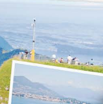
LANDSCHAFTEN Lago Maggiore Dieser See liegt grösstenteils auf italienischem Staatsgebiet, ist aber ein Flutensee der Schweiz. Von allem Locorensen, hier von seiner günstigen Lage, er sorgt mit seinen 15,5 °C im Jahresdurchschnitt für südliches Flair. Doch nicht nur die guten Temperaturen locken, auch das bekannte Flutentfernen wird hier einmal im Jahr veranstaltet.