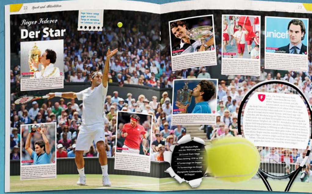
Beispielseiten aus dem Album „Meine Schweiz“.