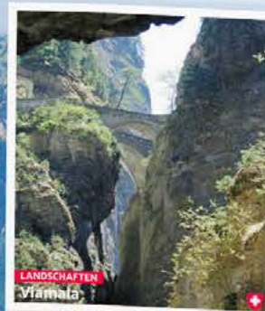
LANDSCHAFTEN Viamala Vorsicht! Hier sind gute Augen und Gleichgewicht gefragt, denn übersetzt heisst Viamala „schlechter“ oder „böser Weg“. Doch trotz der riskanten Überquerung stellte die Schlucht einst den besten Weg zu den Alpentopfen Splügen und San Bernardino dar. Mit der 1903 erbauten Treppe, die ganze 321 Stufen zählt, ist der weniger abenteuerlustigen unter uns aber der Weg nach unten gesichert.