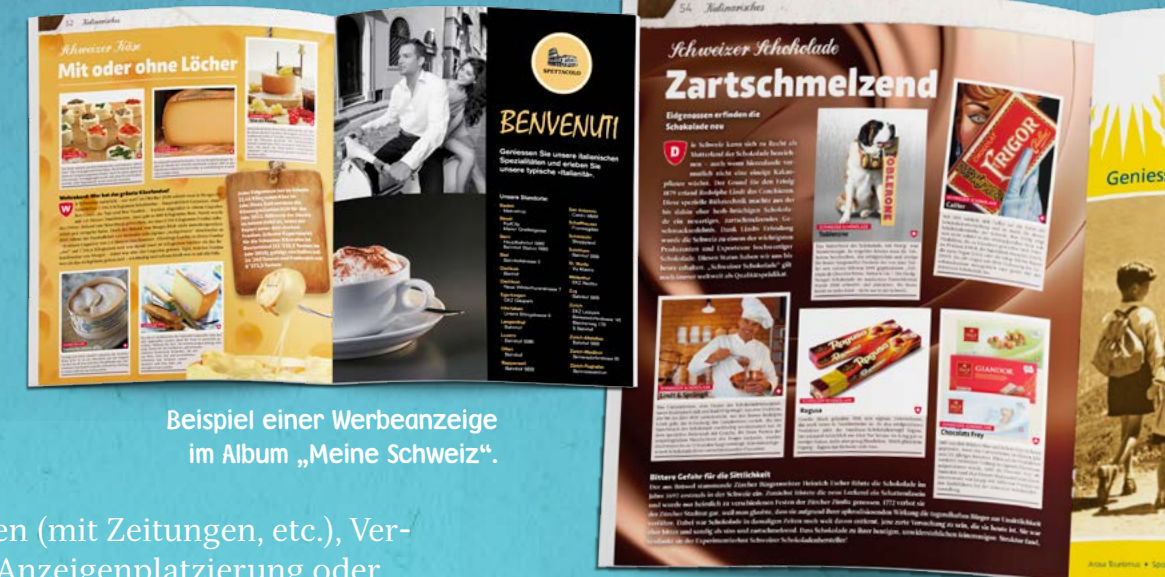
Beispiel einer Werbeanzeige im Album „Meine Schweiz“.

★ Und last but not least: Weil sie Ihren Kunden große Freude bringen. Die erzielten Millionenaufgaben sprechen für sich.