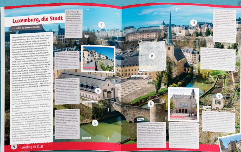
Beispielseite aus dem Album „Mäi Lëtzebuerg“.