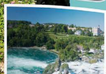
LANDSCHAFTEN Rheinfall Der grösste Wasserfall Europas liegt zwischen den Kantonen Schaffhausen und Zürich. Hierlich lockt er mit seinen riesigen Wassermassen bis zu zwei Millionen Besucher an! Dies liegt wohl auch daran, dass – Insider wissen es – der weltberühmte englische Detektiv Sherlock Holmes hier sein Leben liess, bevor ihn sein Erschaffer Arthur Conan Doyle wegen tieferer Prozesse der Leser lieber wieder zum Leben erweckte.