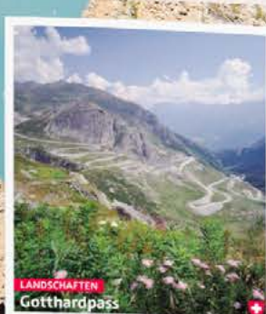
LANDSCHAFTEN Gotthardpass Der Legende nach war es der Teufel selbst, der einst die Teufelsbrücke über die Schöllenen Schlucht baute. Anstelle der erhofften menschlichen Seele erhielt er zum Dank einen wütenden Ziegenbock. Vor rund achthundert Jahren soll das gewesen sein. Die Brücke machte die zuvor unüberwindliche Schlucht passierbar. Seitdem ist der Gotthardpass ein wichtiger Verkehrsweg, der die Kantone Uri und Tessin verbindet.