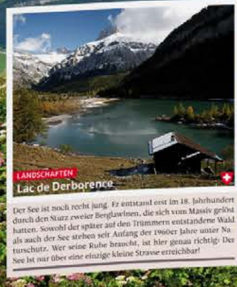
LANDSCHAFTEN Lac de Derborence Der See ist noch recht jung. Er entstand erst im 18. Jahrhundert durch den Sturz zweier Berglawinen, die sich vom Massiv gelöst hatten. Sowohl der See als auch der 1906er Jahre unter Naturschutz. Wer seine Ruhe braucht, ist hier genau richtig! Der See ist nur über eine einzige kleine Strasse erreichbar!

S nowboarden auf Viertausendern, Wanderungen durch saftig-grüne Täler oder idyllische Bergdörfer, Metropolen, in denen das Leben pulsiert – in der Schweiz ist das alles möglich. Nirgendwo sonst auf der Welt liegen Modernität und Tradition so eng beieinander wie in der Eidgenossenschaft. Kein Wunder, dass Jahr für Jahr Millionen begeisterter Besucher aus aller Welt die Schweiz zum Traumziel erklären. In diesem Land gibt es einfach immer wieder neues zu entdecken, auch für Schweizer!